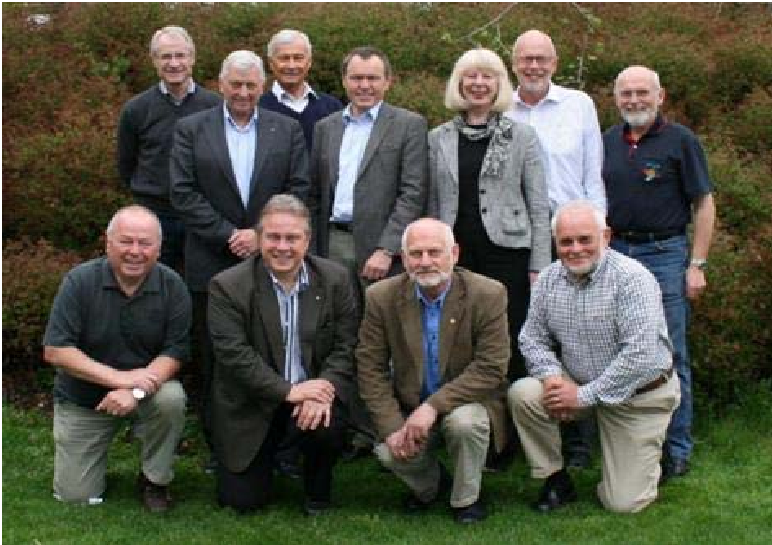
Representanter fra D 2270, 2280 og 2300 på «redistrictingsmøte» i Skogn, mai 2010